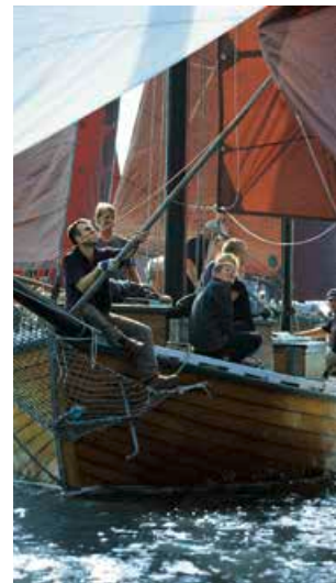
Dutzende braune Segel: maritime Atmosphäre bei der Zeesbootregatta