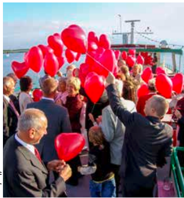
Fotos: Burg Schorssow (rechts), Fohrgeschtsschiff Steußloff (Mitte und links)