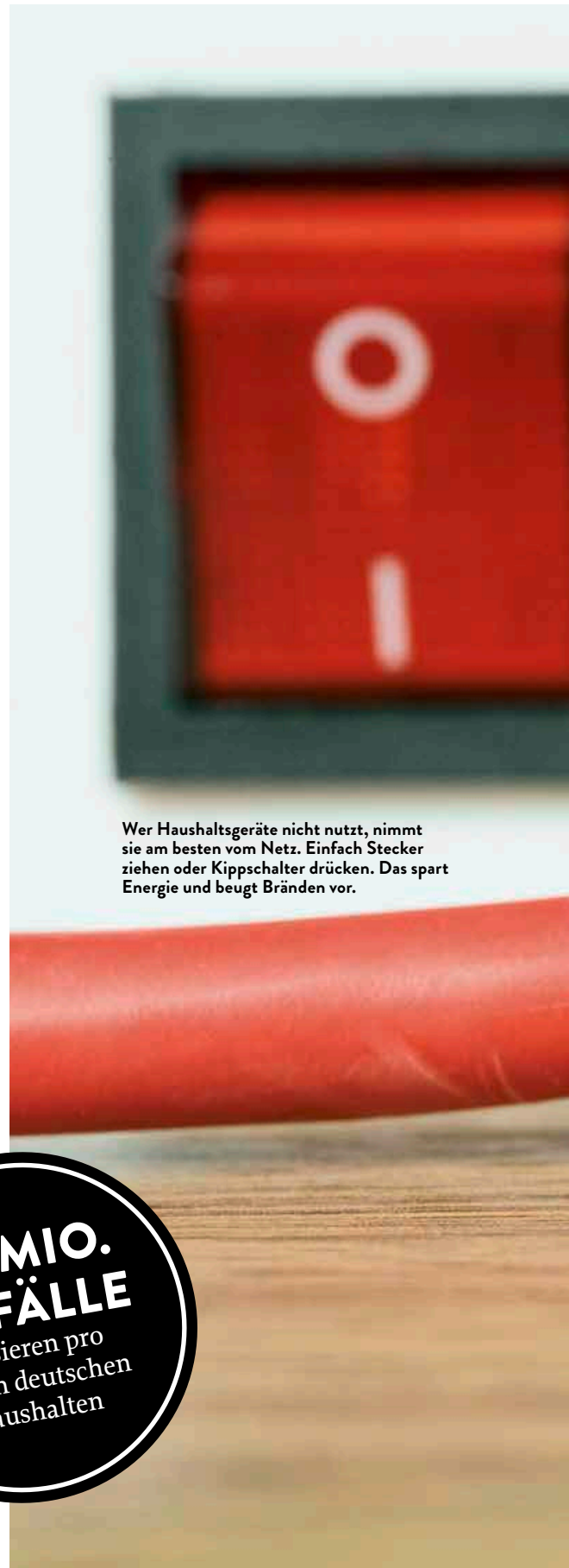
Wer Haushaltsgeräte nicht nutzt, nimmt sie am besten vom Netz. Einfach Stecker ziehen oder Kippschalter drücken. Das spart Energie und beugt Bränden vor.

2,8 MIO. UNFÄLLE passieren pro Jahr in deutschen Haushalten